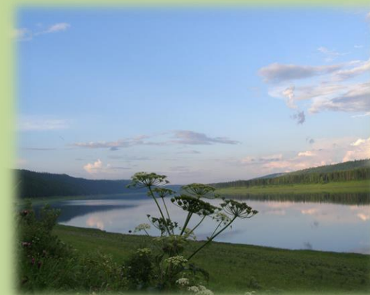
Муниципальное бюджетное учреждение культуры «Централизованная библиотечная система Рыбинского района»

Путешествовать по заповедным местам Красноярского края можно всю жизнь, каждый раз открывая для себя его по-новому.